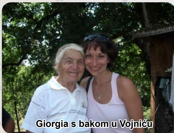
Giorgia s bakom u Vojniću

Vi ste drvodjelje svog života. Svakog dana zakucavate čavle, postavljate daske, ili podignete zid. Vaši stavovi i odluke grade vašu "kuću" sutrašnjice. Gradite mudro!