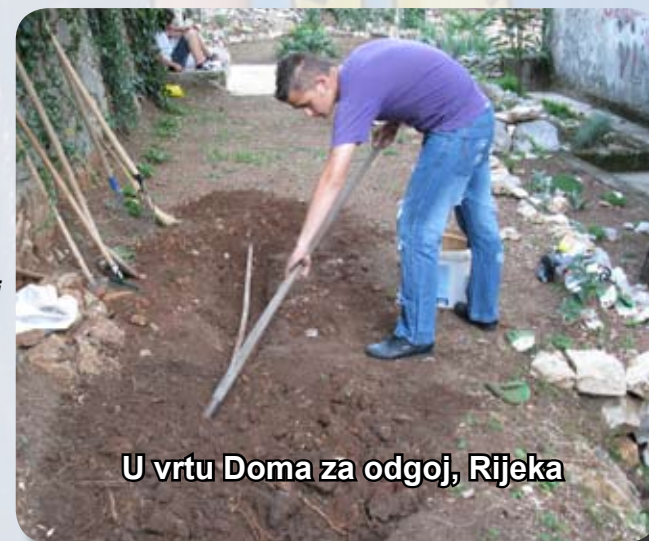
U vrtu Doma za odgoj, Rijeka

Uživajte u životu, jer je kratak. Ali, iskoristite ga za dobro. Ako nekome pomognete, bit ćete sretniji nego što bi ste bili da imate novca, droge i alkohola. Progovorite, i šaljite se. Ne uzimajte sve tako ozbiljno. Bit će vam lakše da prihvatite ono što život nosi, i drugi će vas više voljeti, jer se svi vole smijati i zabavljati!