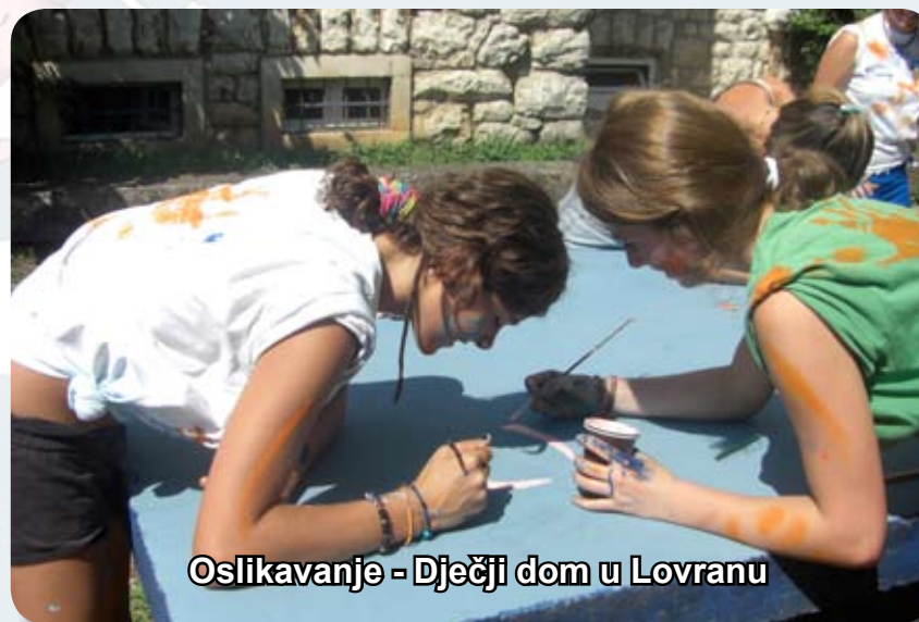
Oslikavanje - Dječji dom u Lovranu

Ljubav je zarazna, ne možete je zadržati samo za sebe. Kao što naši prijatelji u Rijeci kažu: DA BI BIO SRETAN, ČINI DRUGE SRETNIMA!