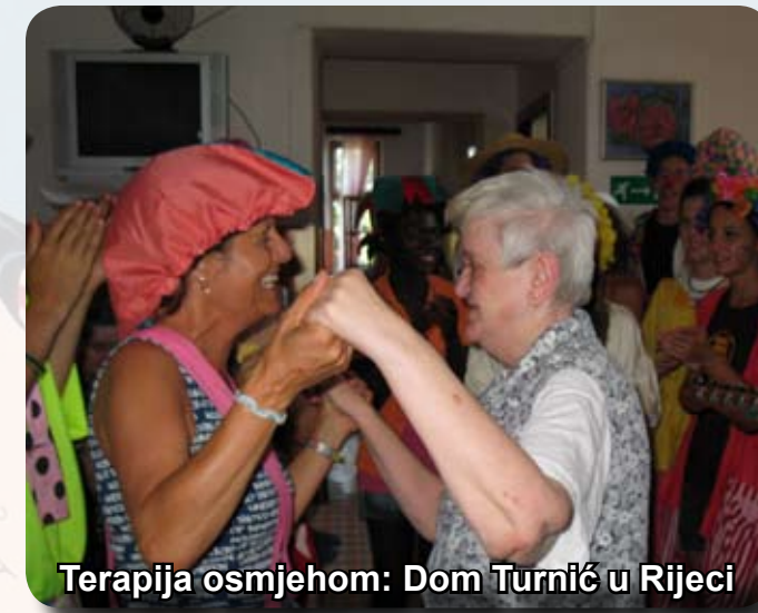
Terapija osmijehom: Dom Turnić u Rijeci

Sjećam se večeri kad smo dijelili "Besplatne zagrljaje" u Opatiji. Neki od njih su bili malo zbunjeni na početku, pitajući se kako će moći zagrliti potpunog stranca. Na kraju su se svi pridružili tome, i kad ih je netko upitao zašto daju besplatne zagrljaje, odgovor je bio: "Zato što su nam svima potrebni."