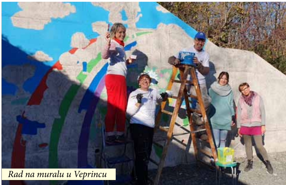
Rad na muralu u Veprincu