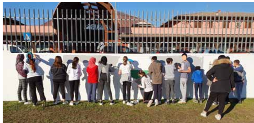
Slikanje murala s mladima u Italiji

Potom smo oslikali vanjski zid koji se nalazi uz igralište omladinskog doma. Srećom, vrijeme nam je bilo naklonjeno i uspjeli smo završiti mural.