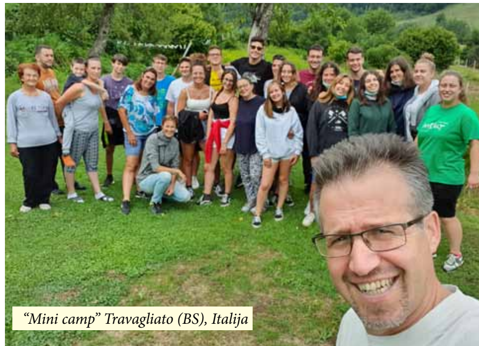
“Mini camp” Travagliato (BS), Italija