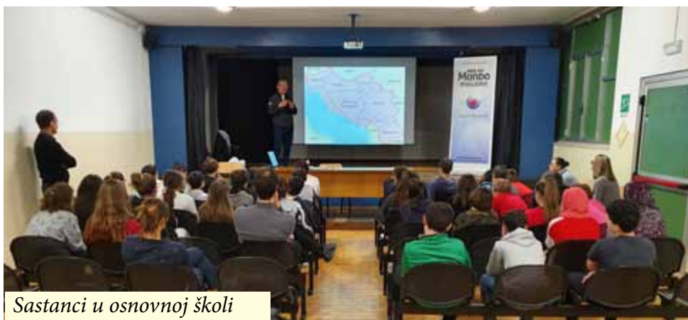
Sastanci u osnovnoj školi