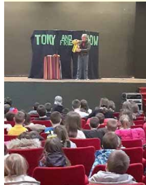
Predstava za djecu u Bihaću

Nakon posjete Bihaću ostali smo u kontaktu, preko Zooma, s volonterima i djelatnicima koje smo sreli u tamošnjim kampovima, a pored riječi utjehe i ohrabrenja koje smo s njima redovno dijelili uspjeli smo im poslati i nekoliko donacija.