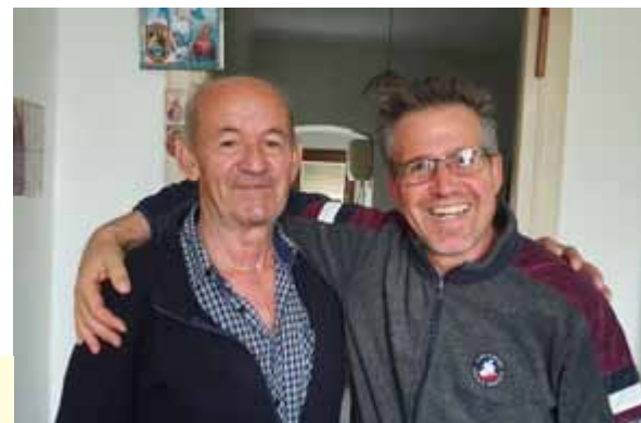
Sa Stipom, u Rijeci

▶ Također smo nastavili dijeliti hranu potrebitim obiteljima, pružati podršku izbjeglicama i odgovarati na brojne telefonske pozive i poruke. S drugim ljudima dobre volje ostali smo u vezi preko interneta, koristeći najčešće Zoom aplikaciju.