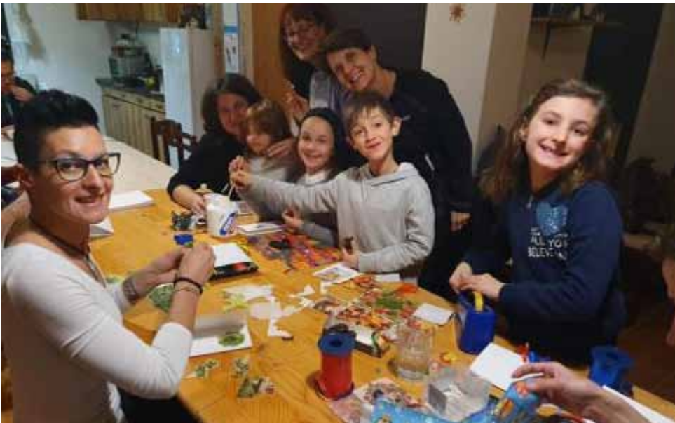
Djeca i mame pripremaju čestitke

Novu godinu proveli smo u posjetu obiteljima na karlovačkom području. Tom prigodom, uz novogodišnje čestitke donijeli smo im i pakete humanitarne pomoći.