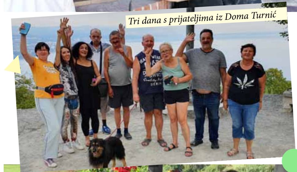
Tri dana s prijateljima iz Doma Turnić