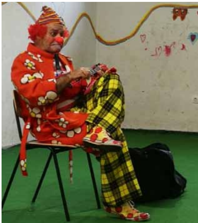
Predstava za djecu u izbjegličkom kampu

Projekt je obuhvaćao: pet dvosatnih sastanaka u osnovnoj školi, kojima je nazočilo 40-tak učenika, s kojima smo razgovarali o volontiranju i kako promijeniti svoj dio svijeta, te o miru i solidarnosti. Također smo predstavili i odigrali igru srce (Game of Hearts).