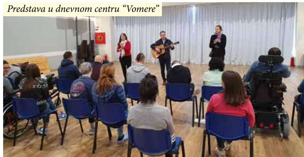
Predstava u dnevnom centru “Vomere”

Jednog smo jutra posjetili centar za osobe s invaliditetom pod nazivom “Vomere” i improvizirali animaciju s pjesmama te naš legendarni igrokaz Milosrdni Samaritanac. Glumci su bili pacijenti centra, a njihova izvedba skeča bila je jedna od najoriginalnijih koje smo ikada vidjeli!