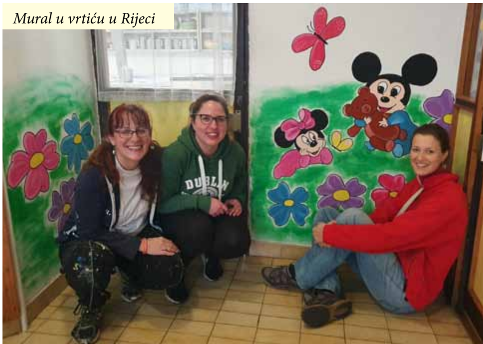
Mural u vrtiću u Rijeci

Uspjeli smo oslikati mural u dječjem vrtiću “Kvarner” u Rijeci, nakon čega je započela era koronavirusa (Covid-19), što je značilo da je većina naših projekata i aktivnosti bila otkazana, a mi smo otprilike sljedeća dva mjeseca proveli u lockdownu.