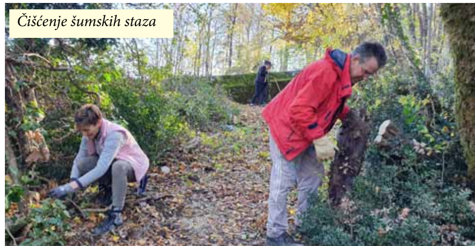
Čišćenje šumskih staza

▶ Kao i prethodnih godina, i ove smo se godine pridružili lokalnim inicijativama čišćenja susjedstva. Ovoga puta posebnu pažnju posvetili smo čišćenju i održavanju obližnjih šumskih staza.