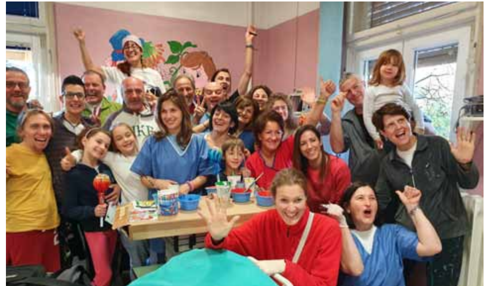
Ekipa koja je oslikala mural u dječjoj bolnici Kantrida u Rijeci

Sljedeća dva dana, 2. i 3. siječnja, slikali smo nekoliko murala u dječjoj bolnici na Kantridi (u Rijeci) u sklopu projekta pod nazivom "Veseli zidovi". Našoj primarnoj skupini od 20-tak volontera pridružili su se i volonteri iz