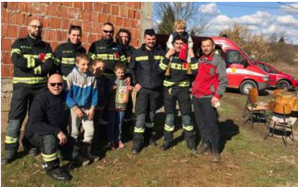
Posjet siromašnim obiteljima s talijanskim vatrogascima

▶ Za vikend su nas posjetili sedmorica vatrogasaca iz Rovereta (TN) u Italiji. Stigli su s dva službena vozila, 700 kg hrane i školskog pribora i ushićeno nam se pridružili u našim aktivnostima.