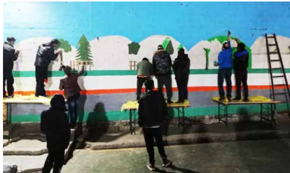
Mural u izbjegličkom kampu Bira

▶ Posljednji tjedan veljače proveli smo s grupom volontera, u Bihaću , BiH, u suradnji s organizacijom IPSIA. Kako bismo mogli ispuniti sve zadane ciljeve podijelili smo se u dvije ili tri skupine. Jedna je skupina, uz pomoć mladih migranata, slikala nekoliko murala u kampu Bira, a druga je skupina pak radila mural u dječjoj bolnici. Pored toga izveli smo i tri predstave: jednu za djecu i njihove obitelji u kampu Borići, drugu za obitelji u kampu Sedra, a treću za 400 djece u kulturnom centru povodom 760-te