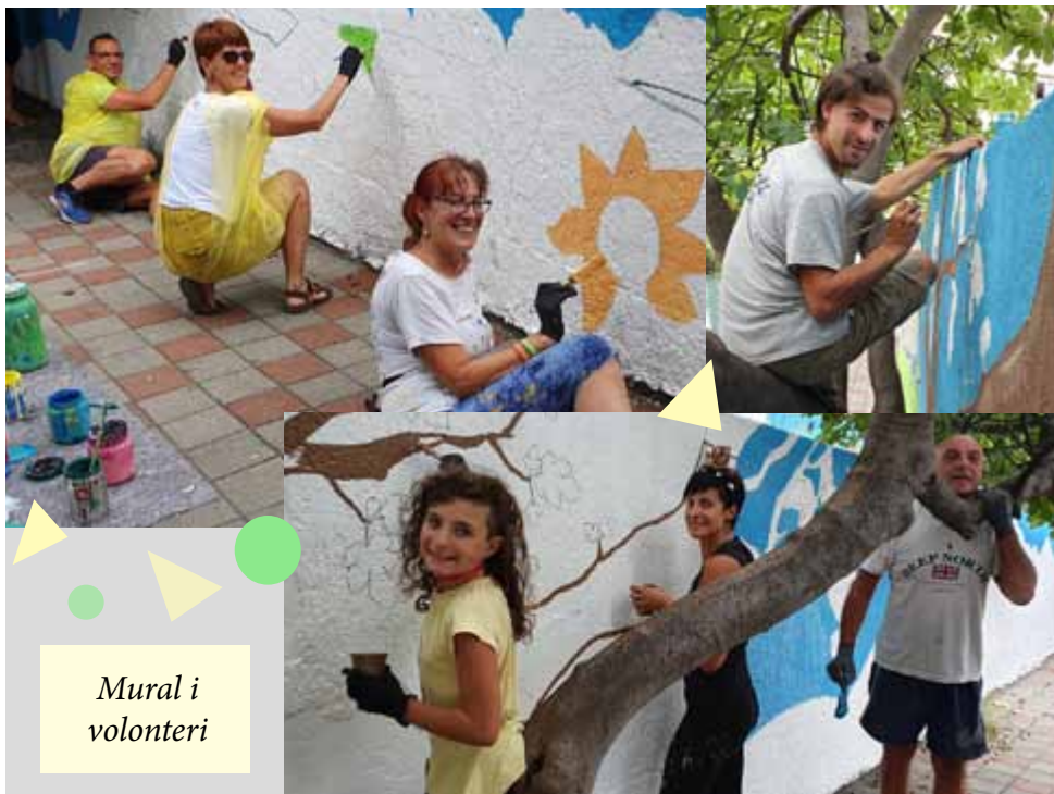
Mural i volonteri