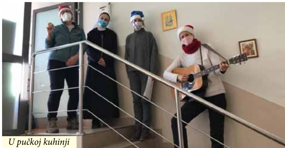
U pučkoj kuhinji

Sljedećeg dana posjetili smo Pučku kuhinju u Rijeci i otpjevali nekoliko božićnih pjesama .