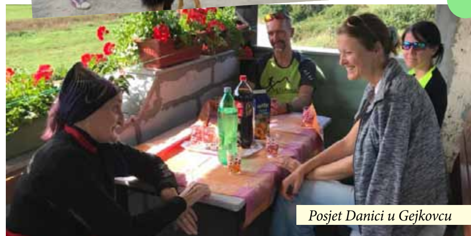
Posjet Danici u Gejkovcu

Krajem rujna ponovno smo posjetili obitelji na području Vojnića i uručili im humanitarnu pomoć.